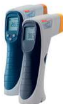
TERMOMETRO INFRARROJO SERIE: 1237000365 MODELO: DHS115XEL