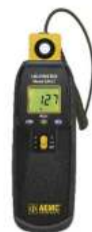
LUXOMETRO DIGITAL 20/200/2000 MARCA PALMER WAHL MODELO CA813 SERIE 1237000365